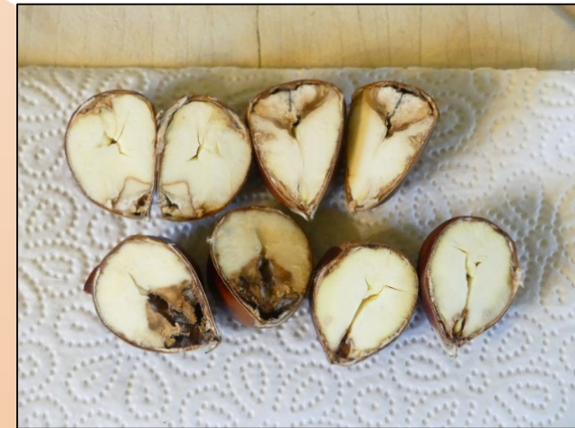
Pourriture des fruits