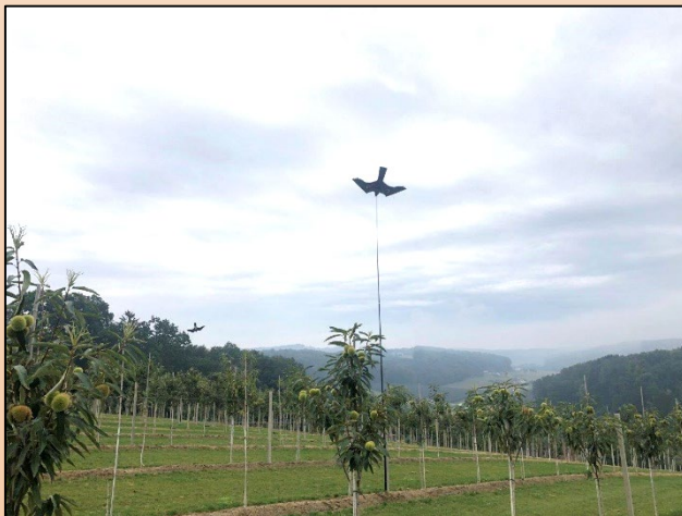
Défense des oiseaux avec des cerfs-volants