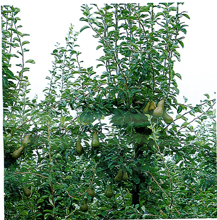
La pera Abate Fetel es la variedad estrella de la producción italiana

En la variedad Limonera, en Francia se observa una floración y cuajados correctos, y se prevé